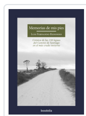
MEMORIAS DE MIS PIES REDONDO, LUIS