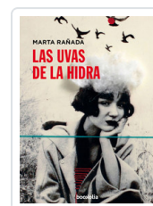
UVAS DE LA HIDRA, LAS RABADA, MARTA