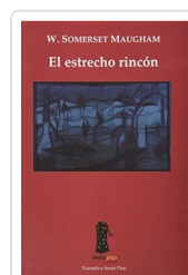
ESTRECHO RINCON MAUGHAM, SOMERSET