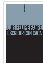
ESCRIBIR CON CACA FABRE, LUIS