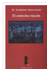
ESTRECHO RINCON MAUGHAM, SOMERSET