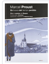
EN BUSCA TIEMPO: POR CAMINO DE SWANN PROUS, MARCEL