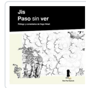
PASO SIN VER JIS