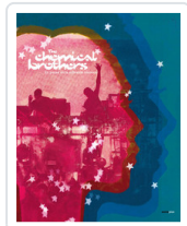
EN PAUSA EN LA REFLEXION COSMICA THE CHEMICAL BROTHERS