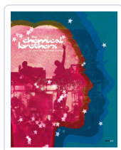
EN PAUSA EN LA REFLEXION COSMICA THE CHEMICAL BROTHERS