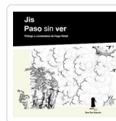
PASO SIN VER JIS