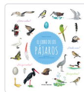
LIBRO DE LOS PAJAROS, EL GUEYFIER, JUDITH