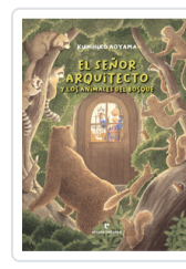
SEÑOR ARQUITECTO Y LOS ANIMALES DEL BOSQUE, EL AOYAMA, KUNIHICO