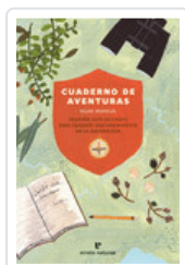
CUADERNO DE AVENTURAS BRODEUR, KEIKO