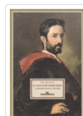
DOCTOR THEMBUSSEM YBARRA, INOGO