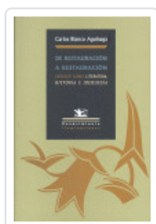
DE RESTAURACION A RESTAURACION BLANCO, CARLOS