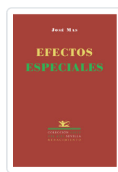
EFECTOS ESPECIALES MAS, JOSE