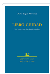
LIBRO CIUDAD LOPEZ, PEDRO