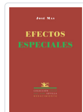
EFECTOS ESPECIALES MAS, JOSE