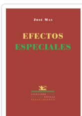
EFECTOS ESPECIALES MAS, JOSE