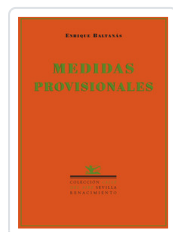
MEDIDAS PROVISIONALES BALTANAS, ENRIQUE