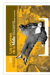
ORIGENES DE LA MAFIA DE TOCQUEVILLE, ALEXIS