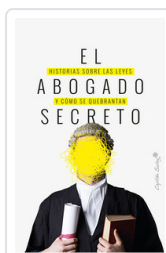
ABOGADO SECRETO, EL AA.VV.