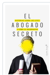
ABOGADO SECRETO, EL AA.VV.