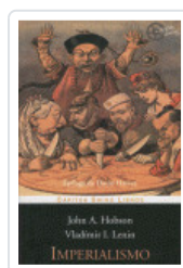
IMPERIALISMO HOBSON, JOHN