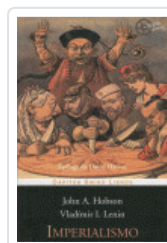
IMPERIALISMO HOBSON, JOHN