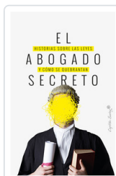
ABOGADO SECRETO, EL AA.VV.