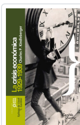
CRISIS ECONOMICA 1929-1939 KINDLEBERGER, CHARLES