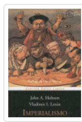
IMPERIALISMO HOBSON, JOHN