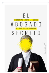
ABOGADO SECRETO, EL AA.VV.