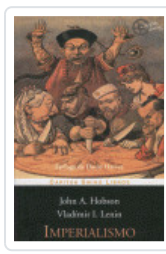
IMPERIALISMO HOBSON, JOHN