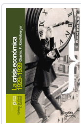
CRISIS ECONOMICA 1929-1939 KINDLEBERGER, CHARLES