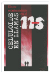
CELULOIDE EN LLAMAS HUERTA, MIGUEL A.