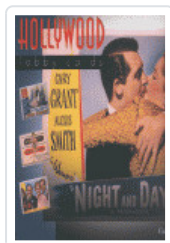
HOLLYWOOD LOBBY CARDS BALMORI, GUILLERMO