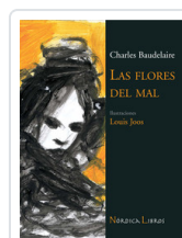
FLORES DEL MAL - ILUSTRADO- BAUDELAIRE, CHARLES