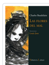
FLORES DEL MAL - ILUSTRADO- BAUDELAIRE, CHARLES