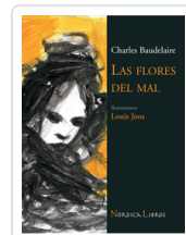
FLORES DEL MAL - ILUSTRADO BAUDELAIRE, CHARLES