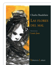
FLORES DEL MAL - ILUSTRADO BAUDELAIRE, CHARLES