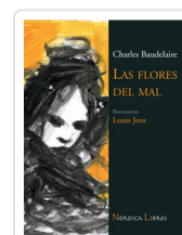
FLORES DEL MAL - ILUSTRADO - BAUDELAIRE, CHARLES