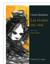
FLORES DEL MAL - ILUSTRADO- BAUDELAIRE, CHARLES