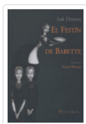
FESTIN DE BABETTE DINESEN, ISAK