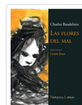
FLORES DEL MAL - ILUSTRADO- BAUDELAIRE, CHARLES