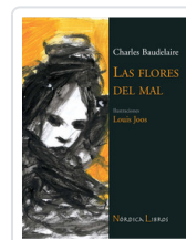
FLORES DEL MAL - ILUSTRADO - BAUDELAIRE, CHARLES