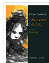
FLORES DEL MAL - ILUSTRADO- BAUDELAIRE, CHARLES