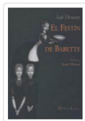
FESTIN DE BABETTE DINESEN, ISAK