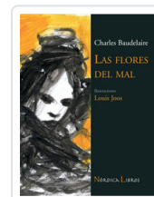
FLORES DEL MAL - ILUSTRADO - BAUDELAIRE, CHARLES