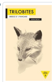
TRILOBITES PANCAKE, BREECE