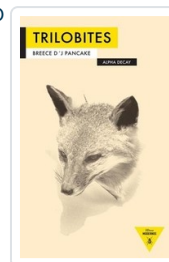
TRILOBITES PANCAKE, BREECE