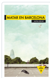
MATAR EN BARCELONA AA.VV.