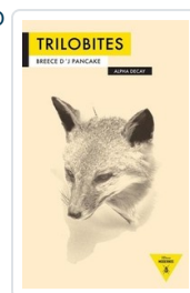
TRILOBITES PANCAKE, BREECE