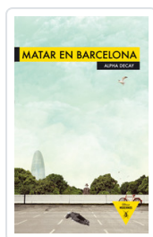
MATAR EN BARCELONA AA.VV.