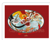
CUATRO DRAGONES ACEVEDO, DESIREE