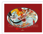
CUATRO DRAGONES ACEVEDO, DESIREE