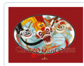
CUATRO DRAGONES ACEVEDO, DESIREE