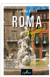
ROMA FUGITIVA LEVI, CARLO