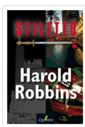
STILETTO ROBBINS, HAROLD