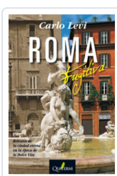
ROMA FUGITIVA LEVI, CARLO