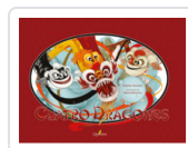
CUATRO DRAGONES ACEVEDO, DESIREE