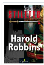
STILETTO ROBBINS, HAROLD