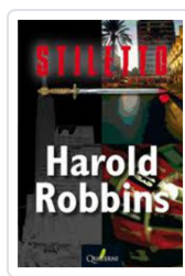
STILETTO ROBBINS, HAROLD