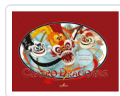
CUATRO DRAGONES ACEVEDO, DESIREE