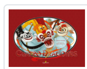
CUATRO DRAGONES ACEVEDO, DESIREE