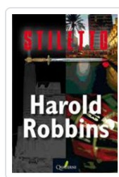
STILETTO ROBBINS, HAROLD