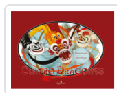
CUATRO DRAGONES ACEVEDO, DESIREE