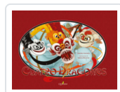
CUATRO DRAGONES ACEVEDO, DESIREE