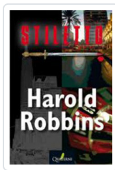
STILETTO ROBBINS, HAROLD