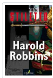
STILETTO ROBBINS, HAROLD