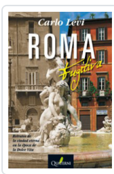
ROMA FUGITIVA LEVI, CARLO