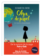
OLGA DE PAPEL - OFERTA- GNONE, ELISABETTA