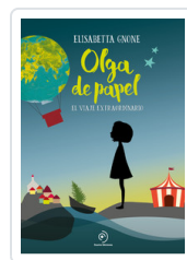
OLGA DE PAPEL GNONE, ELISABETTA