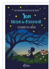
JUM HECHO DE OSCURIDAD GNONE, ELISABETTA