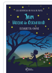
JUM HECHO DE OSCURIDAD GNONE, ELISABETTA