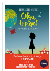
OLGA DE PAPEL - OFERTA- GNONE, ELISABETTA