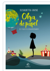
OLGA DE PAPEL GNONE, ELISABETTA