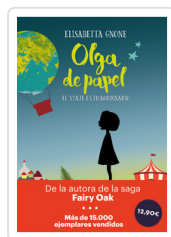
OLGA DE PAPEL - OFERTA- GNONE, ELISABETTA