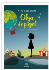
OLGA DE PAPEL GNONE, ELISABETTA