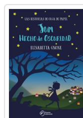
JUM HECHO DE OSCURIDAD GNONE, ELISABETTA