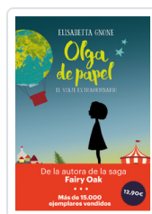
OLGA DE PAPEL - OFERTA- GNONE, ELISABETTA