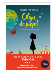
OLGA DE PAPEL - OFERTA- GNONE, ELISABETTA