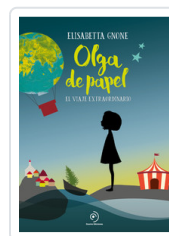
OLGA DE PAPEL GNONE, ELISABETTA