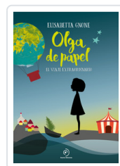
OLGA DE PAPEL GNONE, ELISABETTA