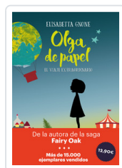
OLGA DE PAPEL - OFERTA- GNONE, ELISABETTA