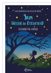
JUM HECHO DE OSCURIDAD GNONE, ELISABETTA